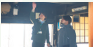
古民家調査の様子